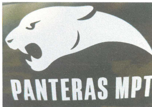
IMAGEN MOTORIZADOS MPT